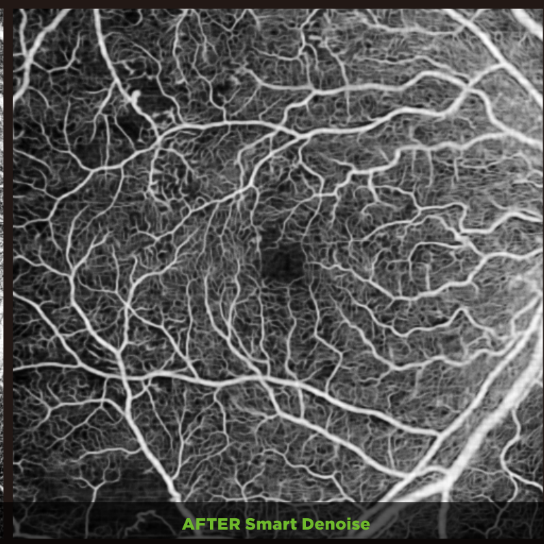
AFTER Smart Denoise